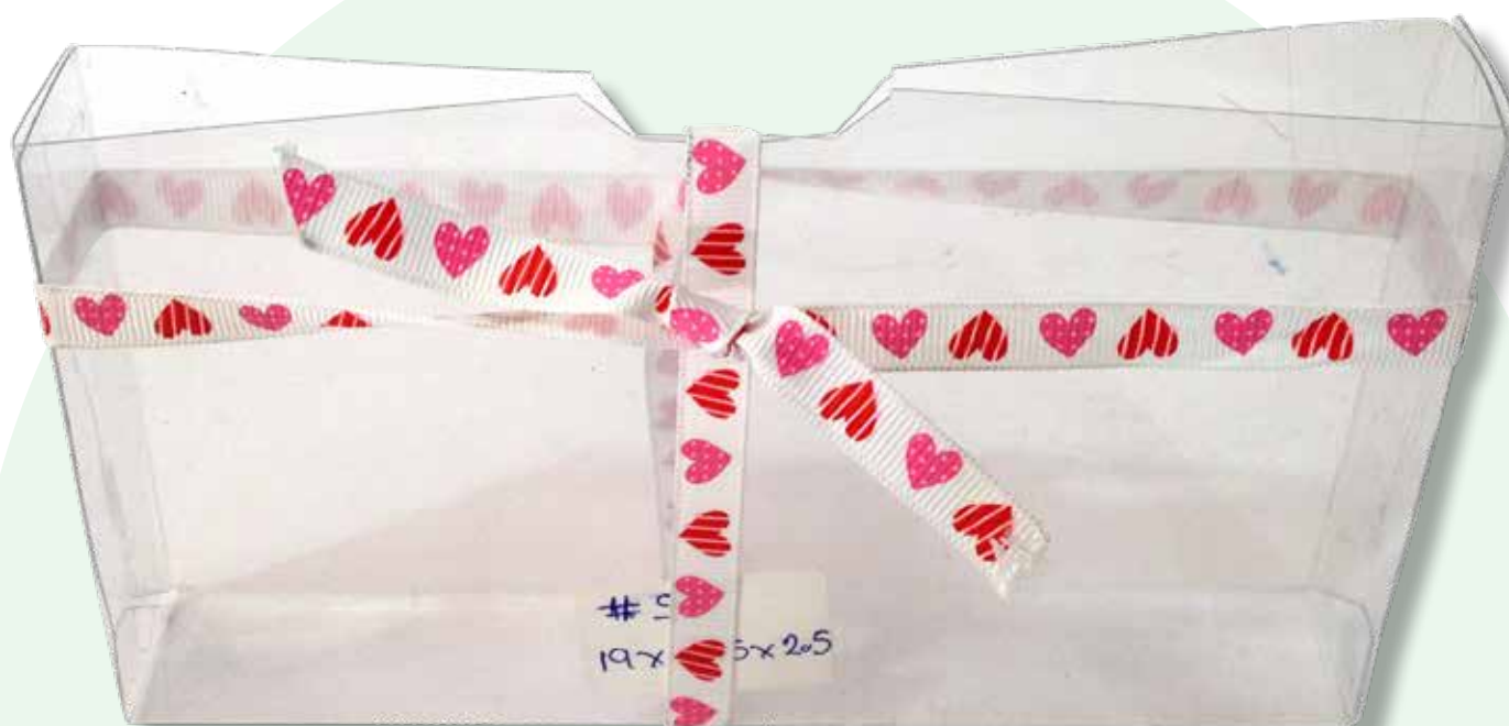
Caja 9 19.0 x 10.5 x 2.5 cm