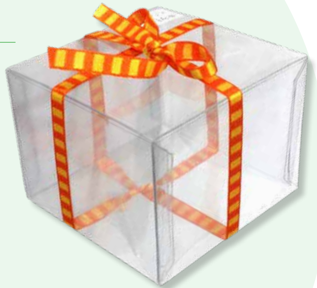
Caja 39 Tapa con 4 pegados (se puede hacer tapa y base) 10.5 X 10.7 X 8 cm