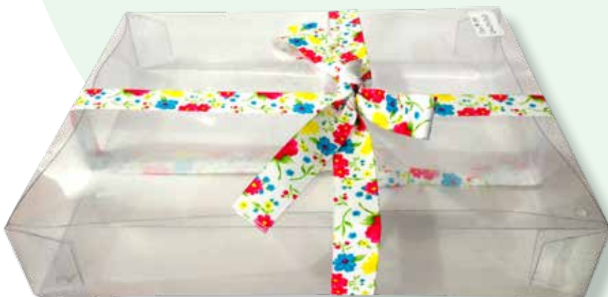
Caja 54 Tapa 8 pegados. 24.0 X 29.2 X 5.0 CM