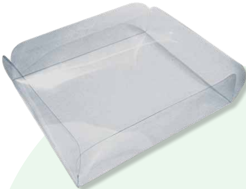
Caja 38 Tapa sin pegado. 35.9x 31.9 x 8.0